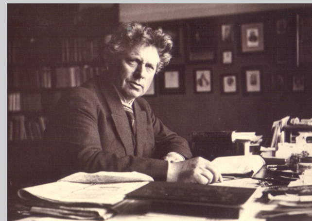
Jeppe Aakjær blev født i Aakjær ved Fly den 10. september 1866. Han døde 22. april 1930 på Jenle. Besøget i hans velbevarede kontor er en naturlig del af en rundvisning på Jenle.

Fra Jenle er der etableret en digterrute, hvor plancher og lyd giver et indtryk af forfatterskabet. For eleverne er ruten måske snarere en dejlig pause i en varieret natur. Ruten går fra Jenle til Jeppe og Nannas grav. Her er der blandingsskov med bæk og anemoner. Videre over strandenge til Astrup Vig og derfra tilbage mod udgangspunktet.