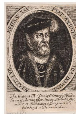
Christian d. 3. og adlen endte som sejherrer.

Bondehæren nåede ifølge en historisk kilde frem til Spøttrup Borg, men det lykkedes dem ikke at bryde gennem forsvarsværket. Kilden fortæller også, at Spøttrup Borg blev brændt ned, men det er svært at sige, om det passer, for der findes ikke tegn på brand på borgen. Måske har det i stedet været borgens ladegård, der blev brændt. Vi ved det ikke. I Biskop Jørgen Friis' lejlighed kan man se, hvordan de store vinduer er blevet lavet om til skydeskår, da det trak op til uroligheder.